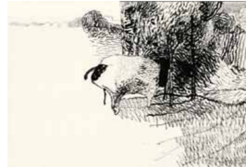
Hagen Klennert Waldstück mit Tier 2008 Tusche, Wasserfarbe auf Papier 20,5 x 29,7 cm