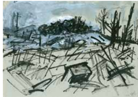
Sylvia Hagen und ewig rauschen die Wälder... 2011 Gouache 21 x 29,7 cm