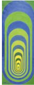
horst bartnig waldweg 1964 Öl auf Leinwand 98,5 x 38,5 cm