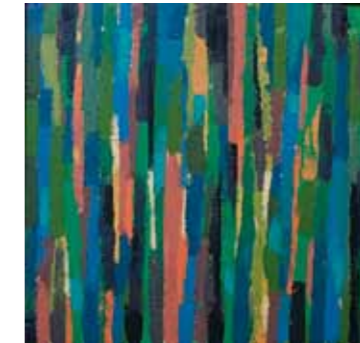
Erika Stürmer-Alex Wald 3 2011 Silikon, Pigmente auf Leinwand 97 x 97 cm