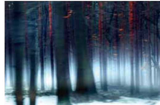
Sabine Wenzel Wald bei Rabenstein 2006 Inkjetprint auf Leinwand 85 x 128 cm