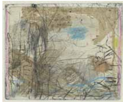
Günter Blendinger Am Waldrand 2004/07 Kaltnadel, zwei Pastellfarben 18 x 20 cm