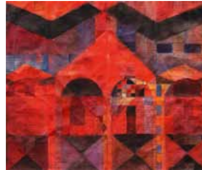
Ruth Tesmar Wald II 2011 Aquarell auf altem Bütten-Buchbogen 36 x 42,5 cm