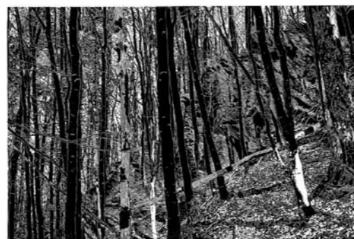
Philipp Hennevogl Fels im Wald 2008 Linolschnitt 75,5 x 113,5 cm