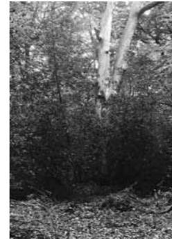
Dietrich Oltmanns aus der Folge Ahrenshooper Holz 2008/09 Silbergelatine auf Baryt 100 x 70 cm