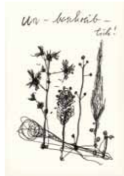
Horst Hüssel Karl unternimmt einen Waldspaziergang III 2009 Nyloprint 33 x 25 cm